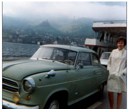
1970 auf der Fähre Gersau-Beckenried. Man beachte die neuen Nebellampen.