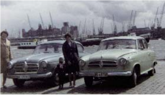
Juli 1964. Beide Isabellen im Hafen von Rotterdam

und die roten Polster der 65-er Isabella. Als Wochenendaufenthalter, zu Hause in Bern, fuhr ich auch nach dem Fahrzeugwechsel am Sonntagabend meistens mit der Bahn nach Neuchâtel-Serrières. Als Ange-stellter der Tramway Neuchâtel (TN) hatte ich auf dem TN-Netz sowieso freie Fahrt und auf der damaligen privaten Bern-Neuenburg-Bahn (BN) günstige Konditionen. Die Isabella stand unter der Woche beim Elternhaus unter Dach in einer einfachen Garage. Am 1. Mai 1968 wechselte ich beruflich zurück in die Deutschschweiz bzw. zur SIM AG, Zylinderschleifwerk, 3018 Bern und zurück ins Elternhaus. Wenn ich nicht mit dem Fahrrad zur Arbeit fuhr, diente mir die Isabella für den Arbeitsweg. 1968 wurde auch das Jahr, wo „uns“ die „beiden“ Eltern bewilligten (nach der Verlobung), „ohne Aufseher“ in die Ferien zu fahren.