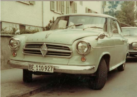
Anfangs August 1969 an unserem Domizil, Heimstrasse 39 / Zu beachten sind die Talbot-Spiegel, der Stab am rechten vorderen Kotflügel als Begrenzungshilfe, sowie die Radzierringe aus Alu.