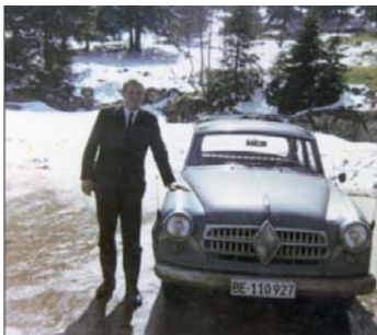
Winter 1966/67 auf der Vue des Alpes / NE. Die zehnjährige Dame mit Skiträger und dem jungen... Die beiden Lampen hatte ich mit Stoffband in die durchgerosteten Lampentöpfe hineingespannt.