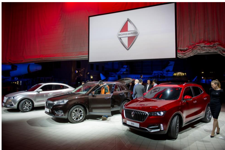
BX6 TS, BX7 und BX5 am BORGWARD Presse Launch 2016 am Automobilsalon in Genève