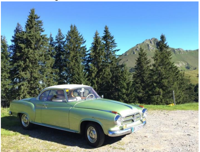
Auf dieser Bergstrasse endete der Ausflug vorerst mit einem verstopften Vergaser

Ab dann lief der Motor nur noch auf der zweiten Stufe, was bei jedem Auskuppeln dazu führte, dass der Motor ausging. Mit telefonischer Unterstützung vom