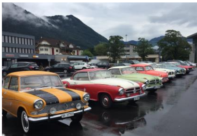
Gemeinsames Parkieren auf dem Weg zum Victorinox-Museum in Brunnen

Die Fahrt ging aus dem Kanton Schwyz heraus in den Nachbarkanton Zug und alle Teilnehmer waren zu einer üppigen Jause eingeladen. Leider war auch an diesem Freitag das Wetter