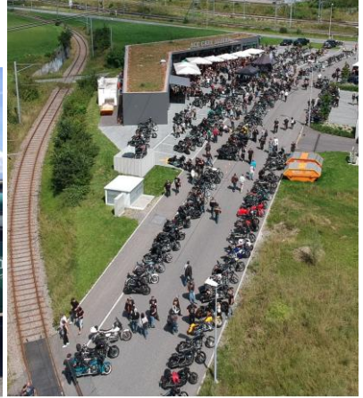
Borgward meets Harley-Davidson im Ace Café Luzern

fuhren mit der ganzen Kolonne durch die nicht enden wollenden Motorrad-Reihen.