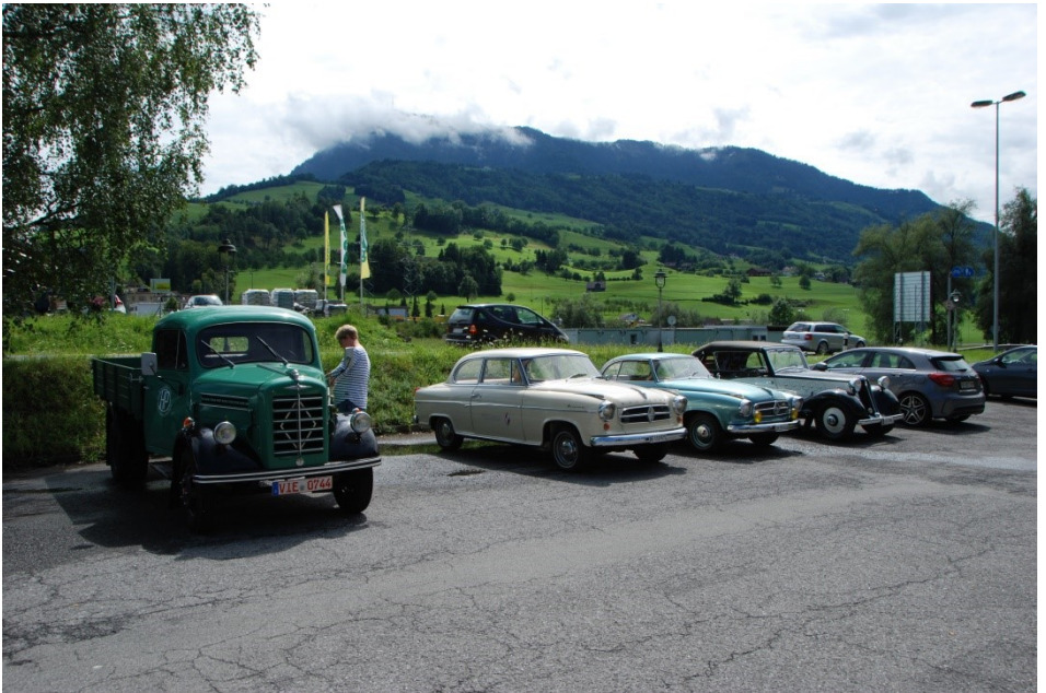
Weitere Gäste unseres Sommertreffens am Samstagmittag im Hotel Frohsinn – im Hintergrund die Rigi.