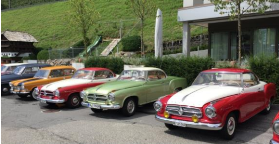
Mittagspause in Küsnacht mit der ersten Sonne der Ausfahrt.

Für den Samstag war am Vormittag die Fahrt nach Brunnen zum Victorinox-Museum mit Führung durch die Geschichte des Schweizer Offiziersmessers (in Deutschland kann man dazu nicht „Sackmesser“ sagen!) vorgesehen. Auf dieser Ausfahrt hatten wir zwar immer noch den einen oder anderen Tropfen auf der Windschutzscheibe, aber es gab auch schon wasserfreie Momente mit beginnender Aussicht auf die Berge.