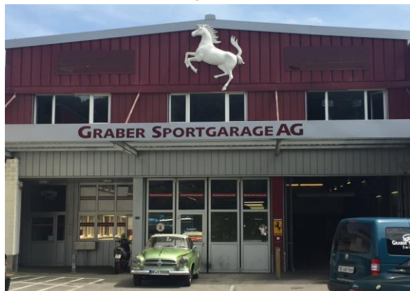
Isabella beim Pferdedoktor

Als ich nach einer holprigen Anfahrt auf der zweiten Vergaserstufe in der Sportgarage