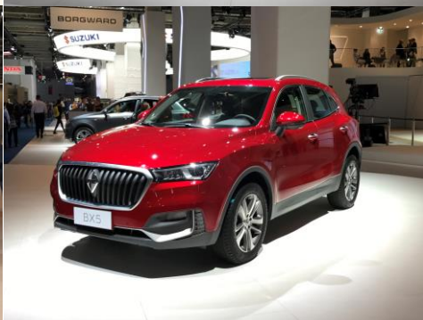
Borgward BX7 , der seriennahe Borgward BXi7 Concept Car , der Borgward BX7 TS Limited Edition und der Borgward BX5 (von links oben nach unten rechts.): Alle Modelle durften Probe gesessen werden!