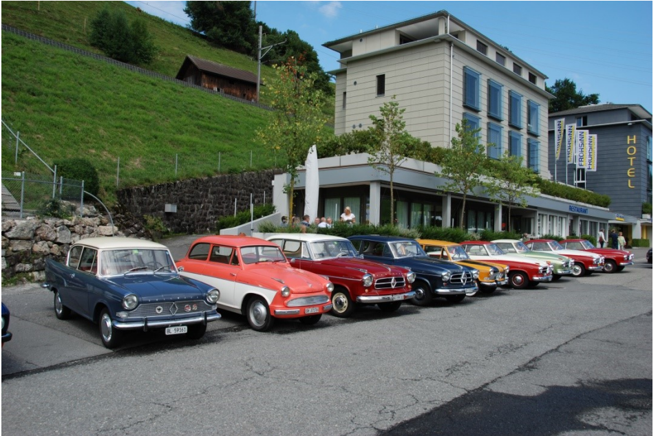
Sommertreffen 2017 - Mittagessen am Samstag Hotel Frohsinn in Küsnacht, das Wetter hat sich gebessert!