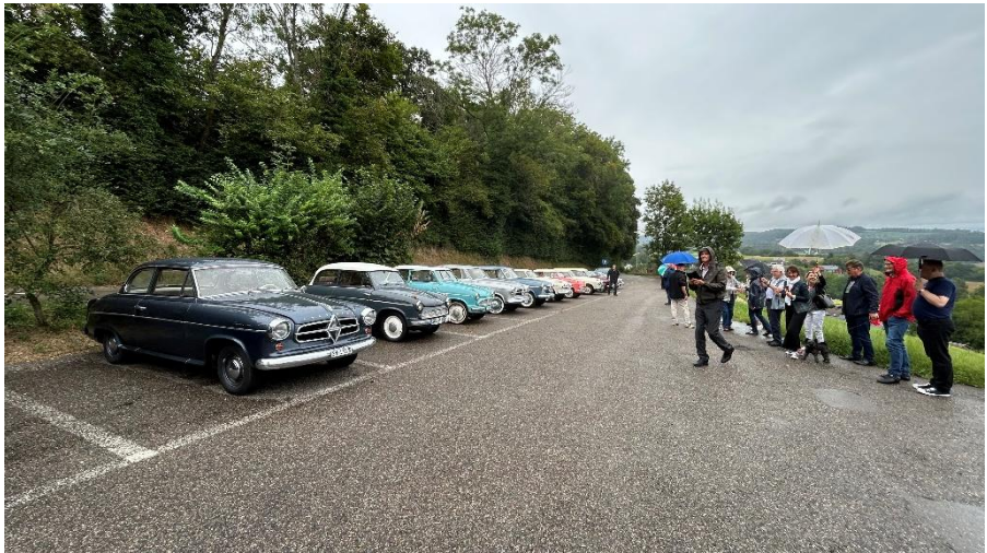
Sommertreffen 2024, Sonntagvormittag, wir haben unsere Fahrzeuge bei der reformierten Kirche in Buchberg SH, einem der schönsten Aussichtspunkte der Gegend für einen Fotohalt aufgestellt.