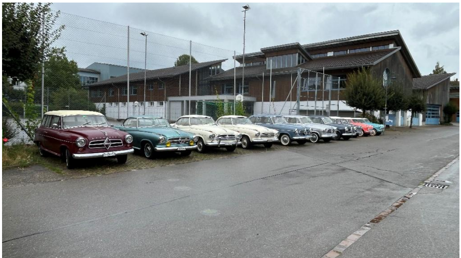
Sommertreffen 2024, am Sonntagvormittag besuchen wir in Buchberg SH die Gattersagi und haben unsere Fahrzeuge gegenüber aufgestellt.